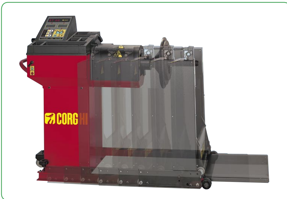
➤ Integrierter pneumatischer Kraftheber für Räder mit einem Gewicht bis zu 150 kg