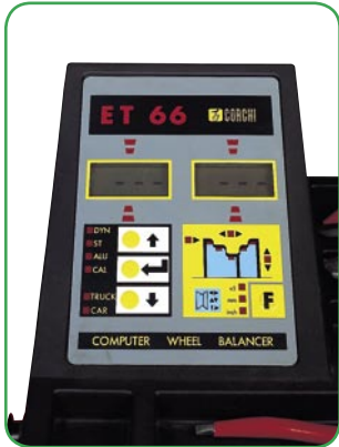
➤ Bedienblende mit doppeltem Display