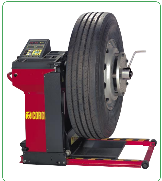
➤ Version mit manuellem Messlauf (Hand Spin)